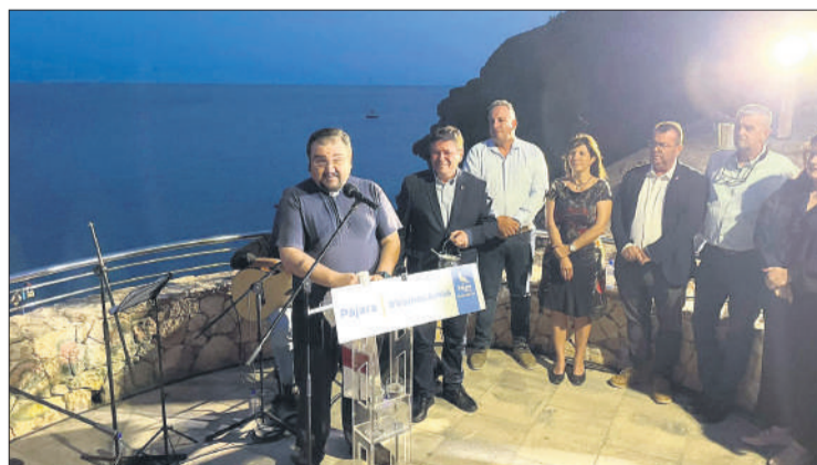
Acto del homenaje a los trabajadores de la mar.