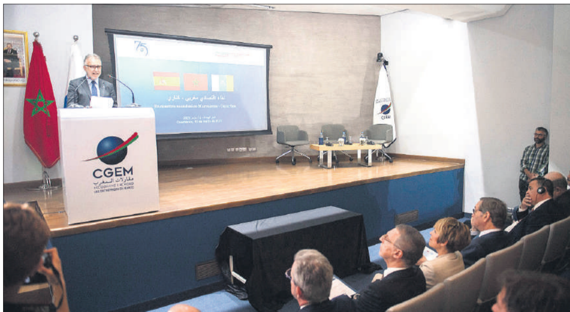
Torres, durante la presentación del estudio de Oportunidades en África para alianzas canario-marroquíes.

Torres subrayó el intercambio de experiencias con empresarios marroquíes y el hecho de que se haya firmado esa adenda al protocolo de colaboración entre Proexca y el Consejo Económico Marruecos-España, “con la que nos comprometemos a caminar junto con otros países de África para que, por ejemplo, empresas canarias puedan licitar obras en Ghana, Costa de Marfil, Mauritania, Senegal...”. En esta línea, Torres destacó el hecho de que cinco compañías del Archipiélago ya han ganado concursos en Marruecos, al tiempo que insistió en la importancia de que el Gobierno marroquí apueste por reactivar la línea marítima entre Tarfaya y Fuerteventura.