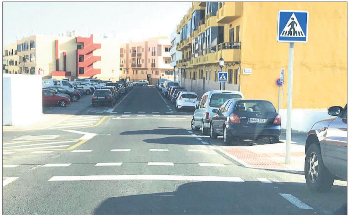
Calle en Corralejo con marcas viales para paso de ciclista y señalización horizontal de paso de peatones.

netes eléctricos (vehículos de movilidad personal): en un principio la DGT dejó su regulación en manos de los ayuntamientos y solo está parchean-