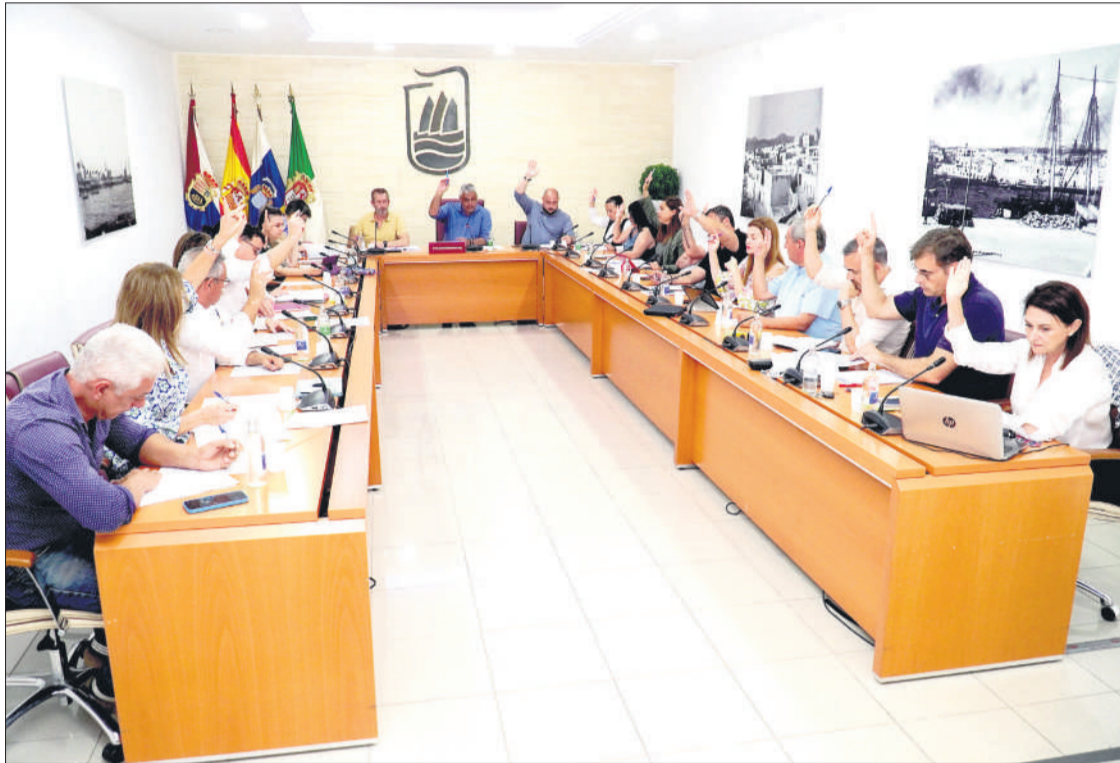
El pleno capitalino aprueba por unanimidad la creación de nuevas licencias de taxis.