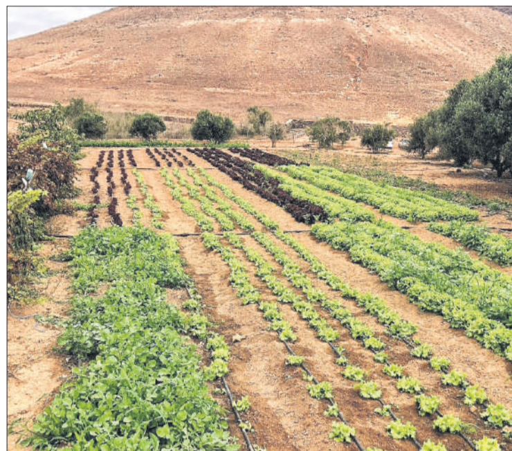
Plantación de cultivos en Fuerteventura.

Muchas de las infraestructuras que demanda el sector ya existen, pero solo sobre el papel. Lamenta Nuez que “el Plan de Regadío de Canarias lleva ya 8 años de trámite”. Y tiene razón. Este plan contempla 68 millones de euros para toda Canarias, con la participación de los cabildos, comunidades de regantes, Gobierno regional y el Ministerio a través de Sociedad Estatal de Infraestructuras Agrarias (SEIASA). Dentro del mismo, la única obra prevista en su primera fase Fuerteventura cuenta con 6,5 millones, destinados a un embalse en