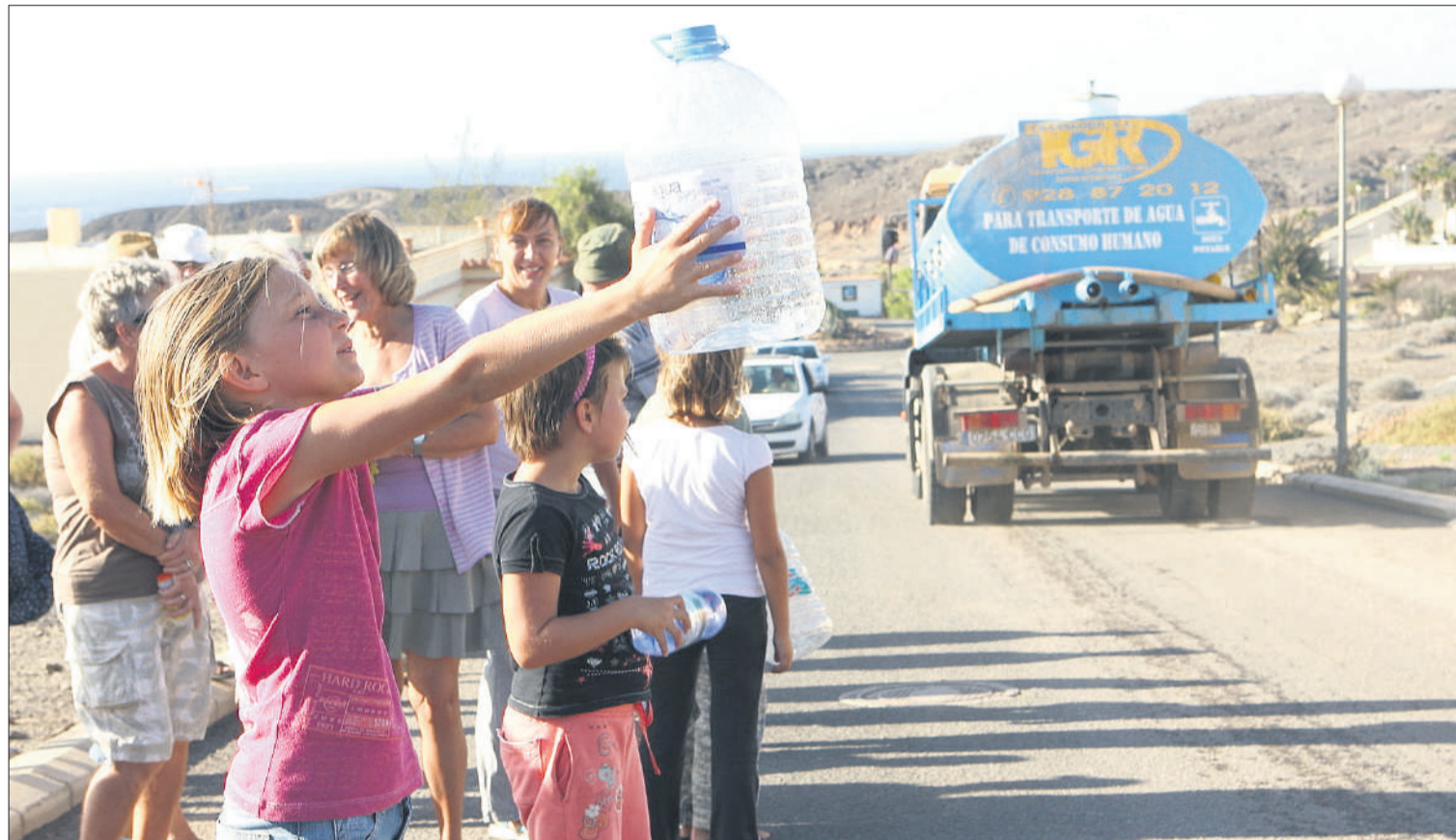
Ahora, igual que hace unos años (imagen de archivo), el problema del agua continua siendo el mismo en enclaves como La Lajita.

El Cotillo fue un ejemplo de ello, cuando la localidad se quedaba sin agua cada vez