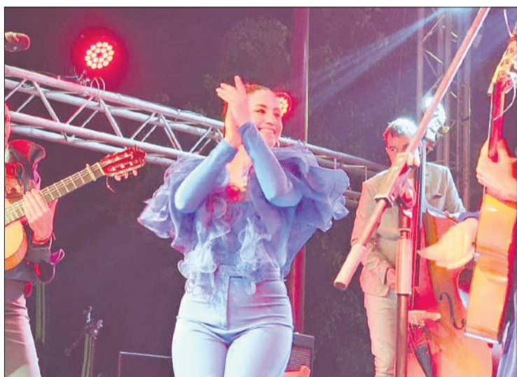
Las Migas, sobre el escenario de Los Pozos.

con un taller floral 'Personaliza una maceta para ti', además de pintacaras con photocall, pompas gigantes, malabares y un concurso de fotografía.