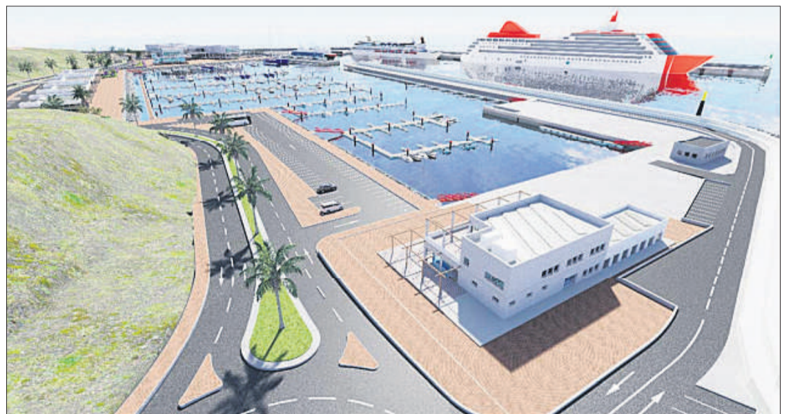
Infografía de cómo quedará el futuro puerto de Gran Tarajal.

trágico del comercio y el transporte marítimo. Muchos han querido vivir de aquellas