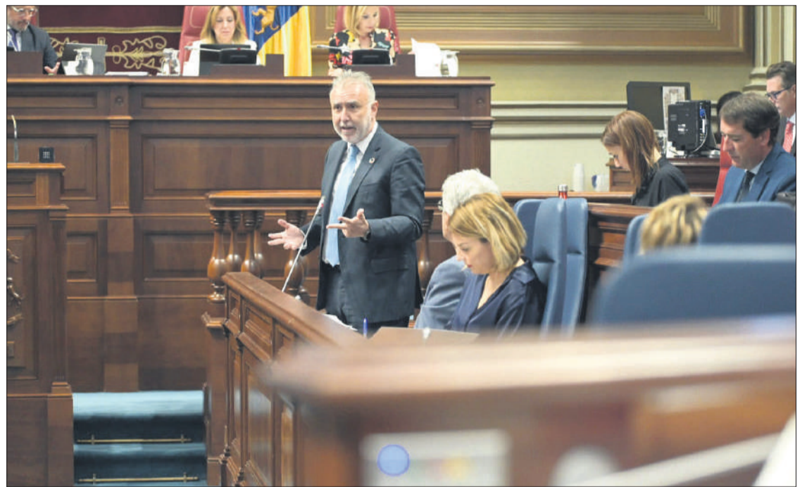
Ángel Víctor Torres, en el Parlamento durante la última sesión de control al Gobierno.

Torres esgrimió la hoja de ruta desplegada en este mandato y el nuevo marco legislativo que se ha impulsado, con leyes como la de Renta Cana-