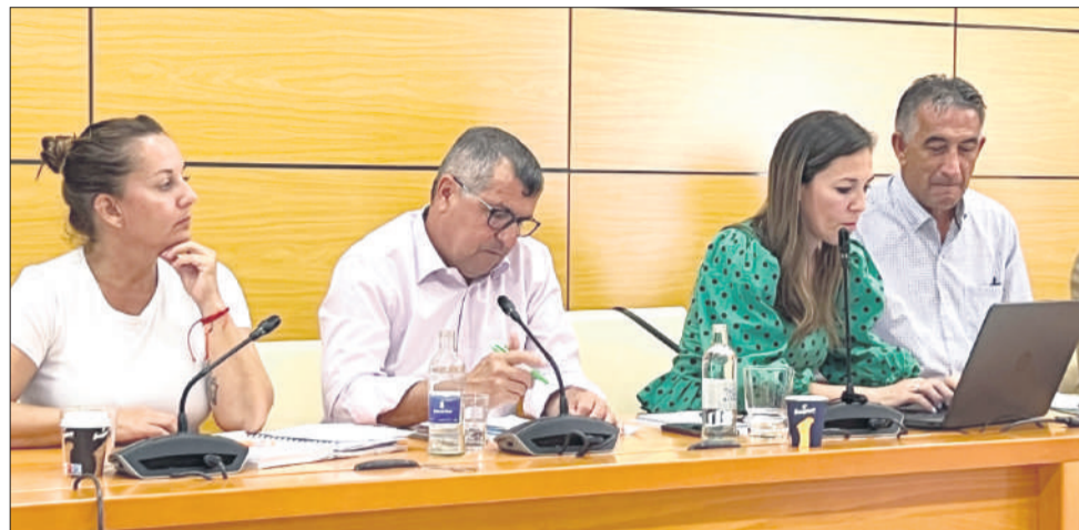
Consejeros del Grupo Popular en el Cabildo de Fuerteventura.

PUERTO DEL ROSARIO El Grupo Popular en el Cabildo de Fuerteventura mostró su indignación por lo que califica como ‘Semana de campaña electoral del presidente Lloret’, que ha supuesto a los majoreros un gasto que alcanza los 143.892 euros. En la última semana que permite la ley para realizar inauguraciones no programadas en el calendario habitual antes de la convocatoria oficial de las elecciones, se formalizaron en el Cabildo retenciones de créditos para más de una decena de contratos por importe superior a los 10.000 euros. Dos ejemplos fueron el cartel instalado en la última adquisición patrimo-