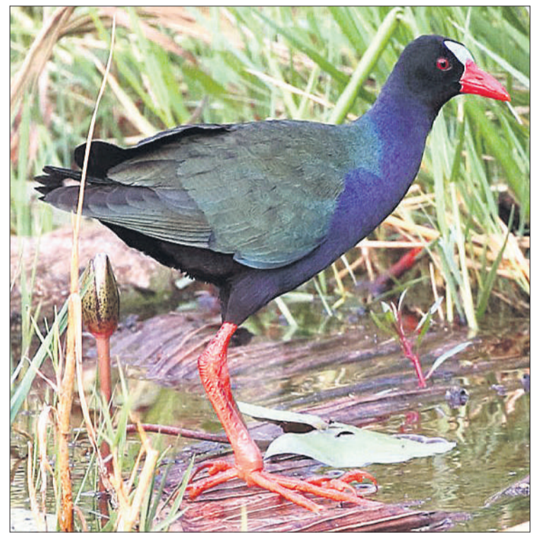
Porphyrio alleni .

La aparición, hace años, de una insólita especie de pájaro que, con suerte, se deja ver una o dos veces al año en las islas orientales, disparó la alarma. Se trataba del calamoncillo africano, Porphyrio alleni . Es una «rara» gallineta de color azul iridiscente que cría en hábitats acuáticos, como marismas, pantanos y lagos, del África subsahariana, en Madagascar, las islas Comores, Mauricio, Bioko y Santo Tomé. Cuando algunos ornitólogos se acercaron a un barranco de Fuerteventura, próximo a Puerto del Rosario, para disfrutar de la extraña apariencia de esta rara ave, descubrieron otro pájaro todavía más raro: la diminuta garcilla africana, propia de los ríos tropicales distribuida al sur del desierto del Sáhara, desde Senegal hasta Sudáfrica.