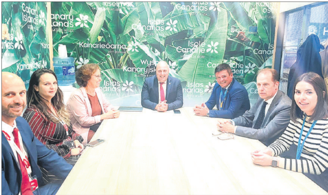
Imagen de la reunión mantenida entre el Ayuntamiento de Pájara y Oasis WildLife en la ITB.