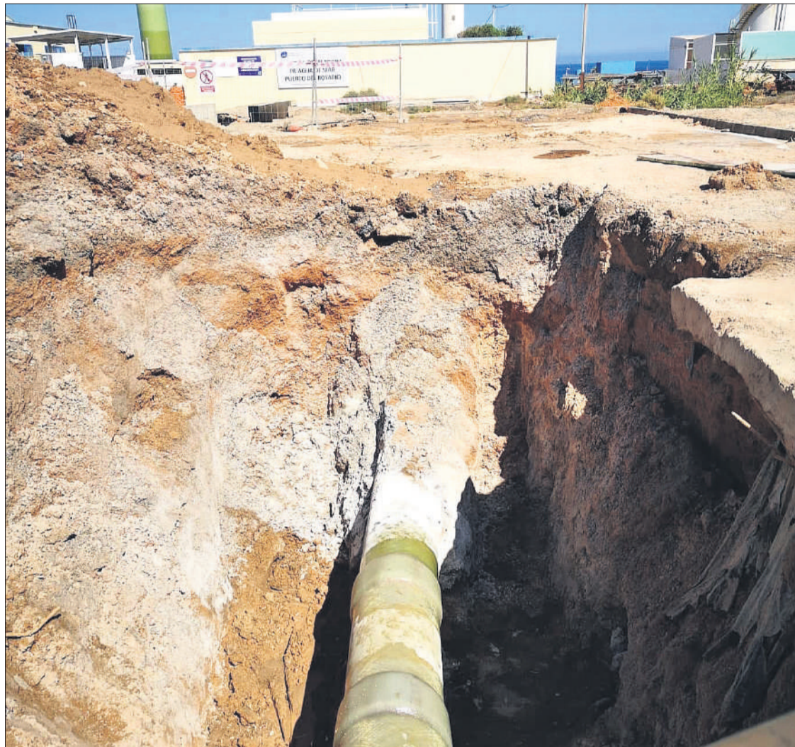
Imagen de una de las últimas averías producidas en la conducción al depósito de La Herradura.