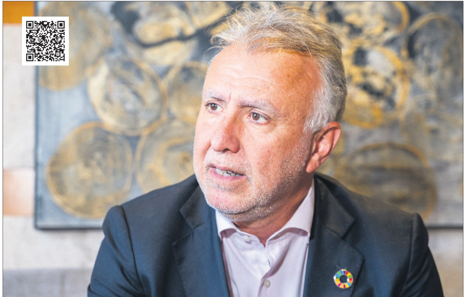
Ángel Víctor Torres, candidato del PSOE a la Presidencia del Gobierno de Canarias.

daño en lo social, en lo económico, en lo estructural y en lo natural como Canarias. Por todo ello, ha sido un mandato complicado y, sin embargo, llegamos con una propuesta basada en que una Canarias mejor era posible y cuatro años después, tras todas estas adversidades, hoy tenemos más empleo que hace cuatro años, más personas que han salido del paro que hace cuatro años, menos jóvenes que engrosen las listas del desempleo; tenemos una educación más plural con, por ejemplo, la introducción de la educación pública y gratuita de 0 a 3 años realizada por el Gobierno de Canarias; tenemos un plan de vivienda con obras que se están levantando en las distintas islas; hemos dado, sin duda, un vuelvo en Dependencia con cerca de 10.000 prestaciones en un año y cerca de 20.000 personas atendidas; y tenemos una importante inversión pública