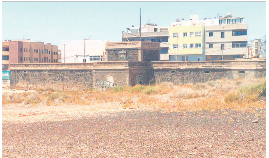
Depósitos de La Charca.