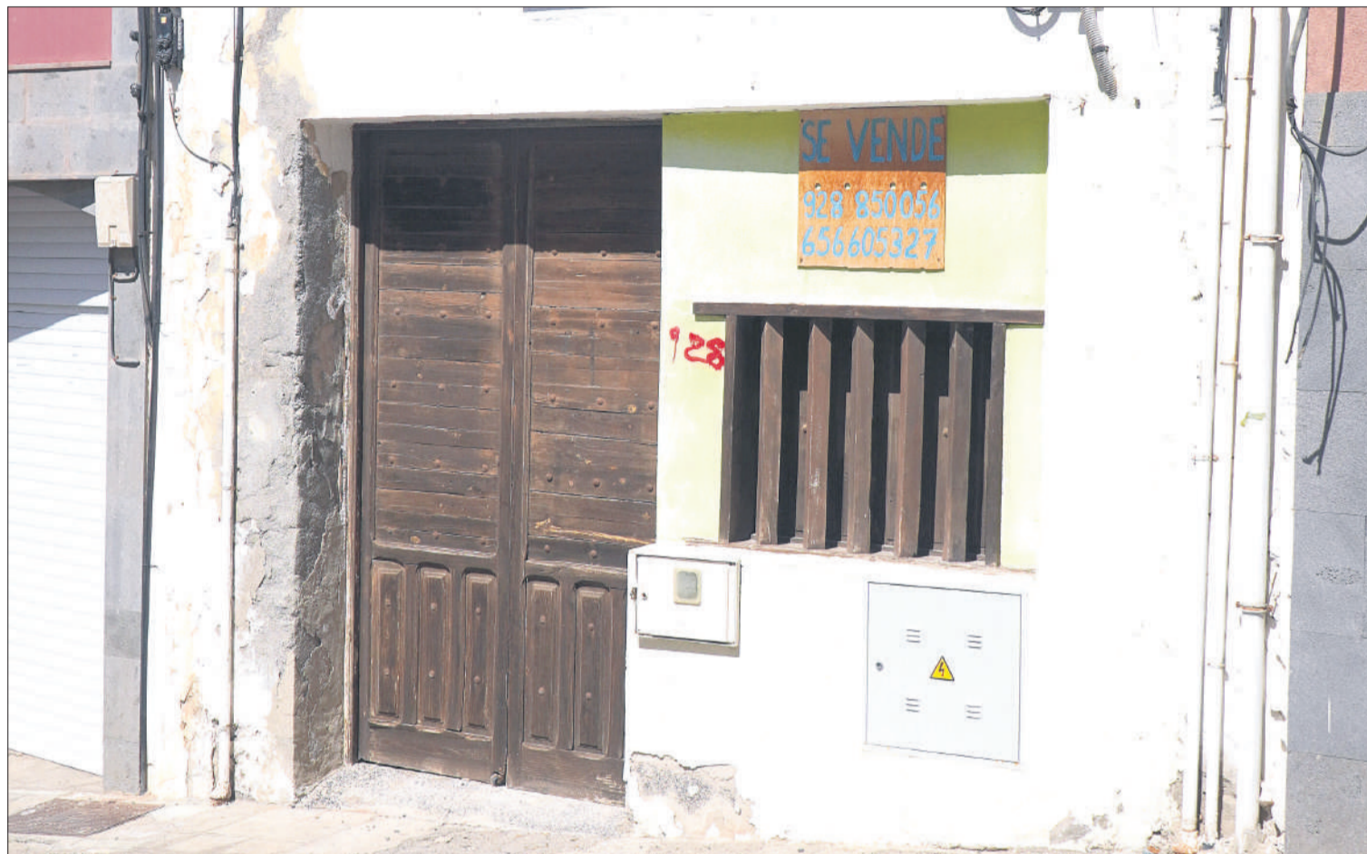
Imagen de la primera ermita de Puerto del Rosario.

Centrándonos en el propiamente denominado patrimonio cultural -hasta hace poco histórico-, podríamos realizar un recorrido a través de los logros verificados en cada uno de los municipios mayoreros y del Cabildo insular. Si fuéramos a evaluarlos, la nota sería la misma para todos ellos: suspenso. Y es que en la cuestión del patrimonio cultural, a pesar de la nueva Ley de Patrimonio Cultural de Canarias (2019) apuntar las obligaciones de los ayuntamientos y cabildos al respecto, debemos recordar que al presente ningún consistorio mayorero cuenta con el obligado Catálo-