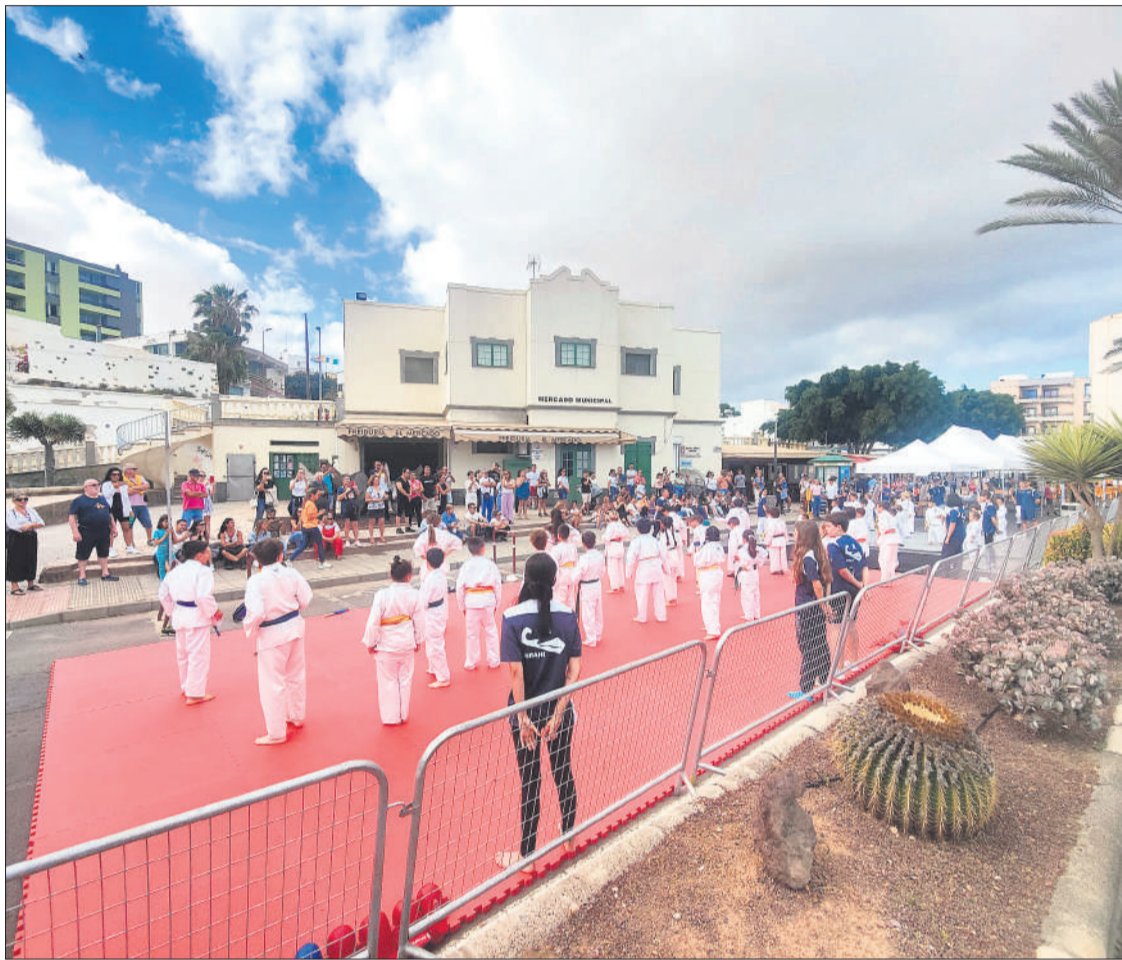
Exhibición de artes marciales durante el evento 'Deporte en la calle'.

● Una treintena de clubes y entidades vinculadas al deporte acuden a la cita organizada por la Concejalía de Deportes capitalina