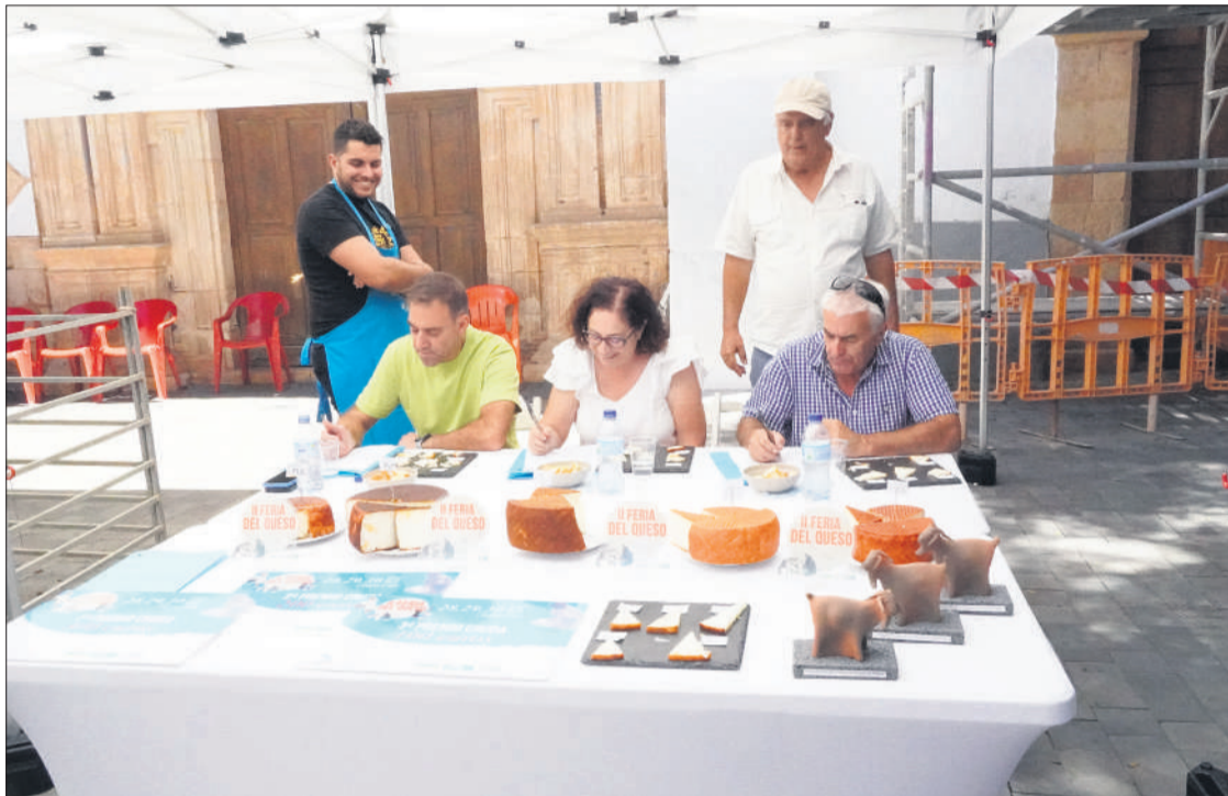
Jurado de los Concursos de Queso Leche Pasteurizada y Queso de Leche Cruda

Quesería Julián Díaz, Quesería La Pared y Quesería Maxorata logran los tres primeros premios del Concurso de Queso Pasteurizado celebrado durante la feria