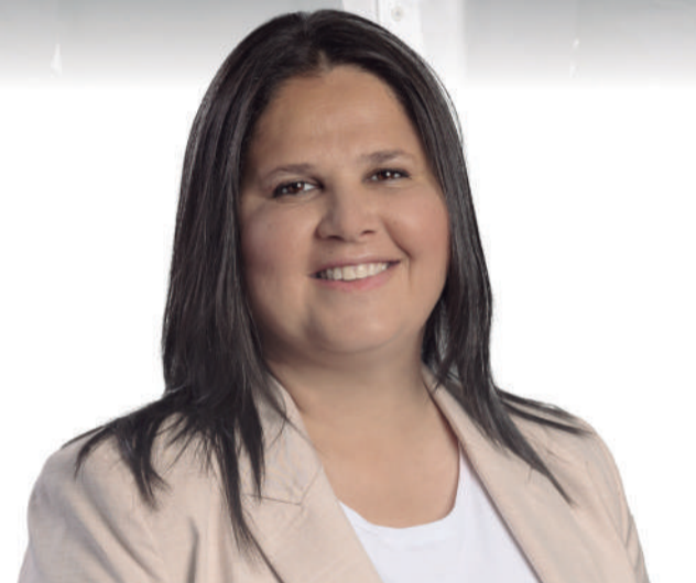
ESTHER HERNÁNDEZ Candidata a la Alcaldía de Tuineje