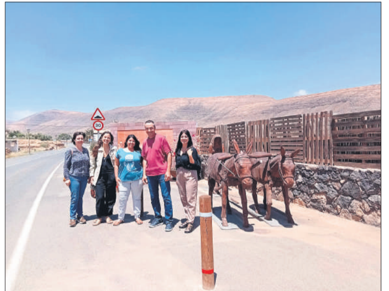
Vecinos de Guisgüey junto a la concejala de Medio Ambiente.