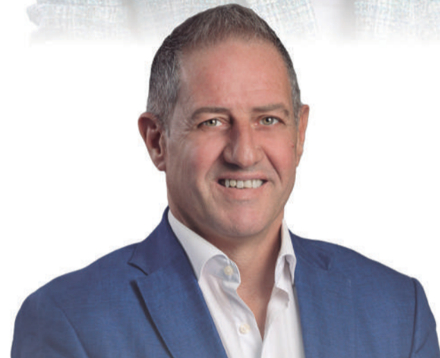
GUSTAVO BERRIEL Candidato a la Alcaldía de Antigua