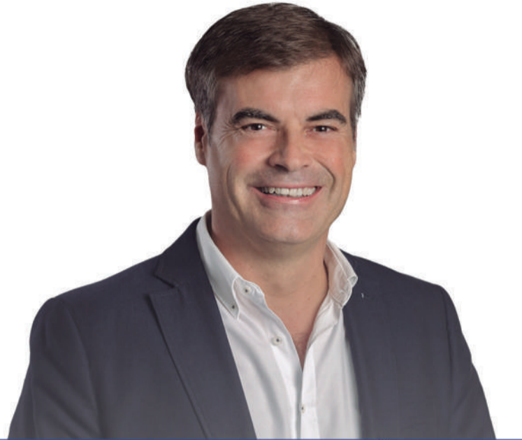
FERNANDO ENSEÑAT Candidato a la Alcaldía de Puerto del Rosario y al Parlamento