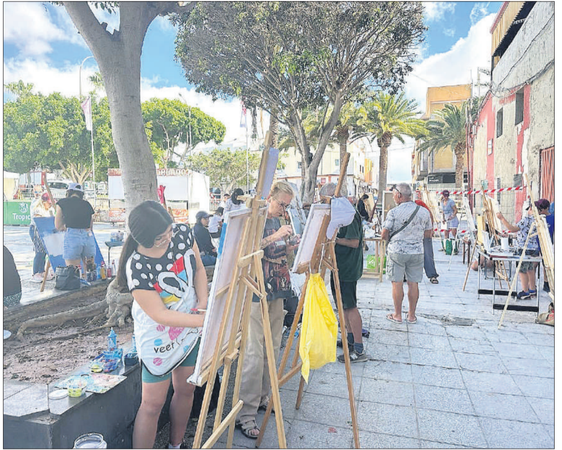
Imagen de algunos participantes en el II Certamen de Pintura al Aire Libre.

Las obras del II Certamen de Pintura al Aire Libre se pueden visitar en la Casa de la Cultura de la capital hasta el 31 de mayo de lunes a viernes en horario de mañana y tarde.