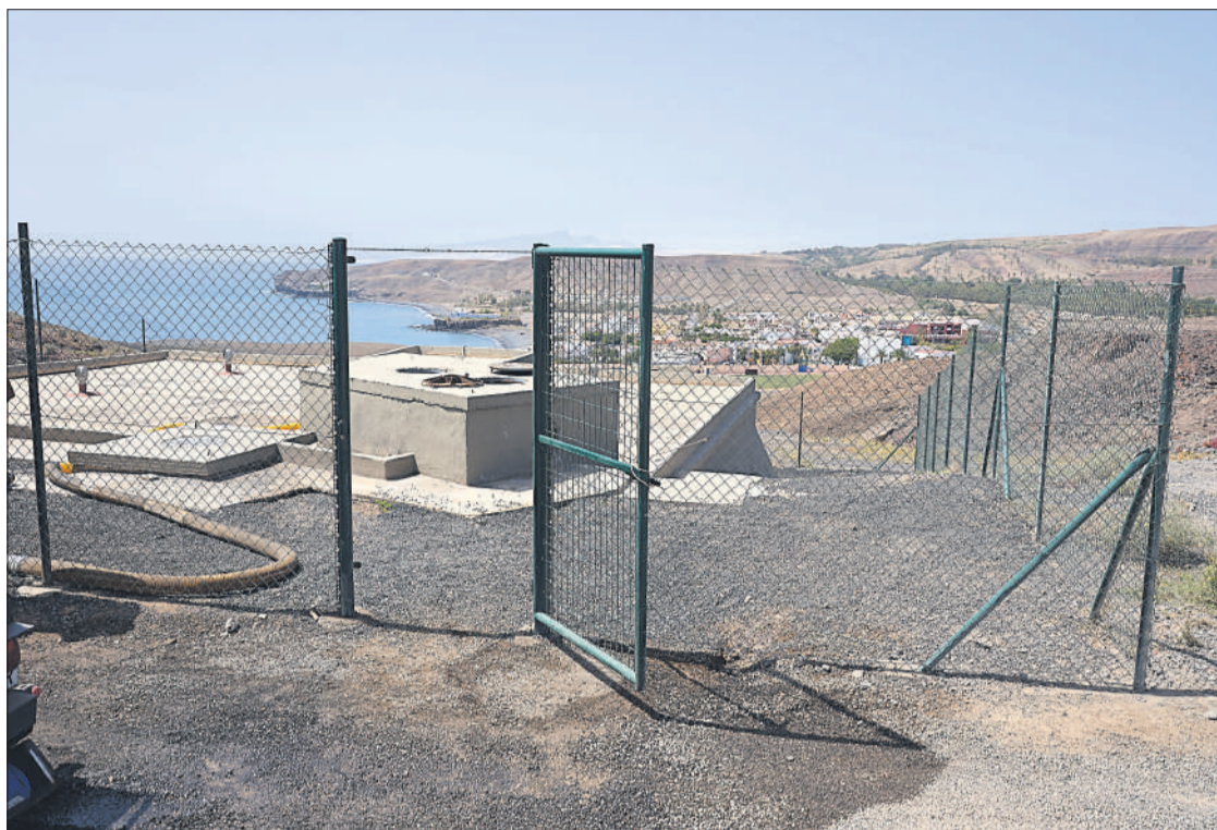
Depósito de agua en el sur de la Isla.

PLANES SIN EJECUTAR. La insuficiente gestión para acabar con el problema del suministro del agua en Fuerteventura no es un tema aislado en el expediente del presidente Sergio Lloret. A lo largo de esta legislatura se pueden encontrar más ejemplos que avalan su deficiente trabajo para sacar adelante los asuntos que preocupan a la ciudadanía. Si bien llevar el agua a cada domicilio de esta isla es una prioridad incuestionable, hay otros temas que durante el próximo mandato esperan tener mayor suerte que la que han tenido hasta ahora. Entre ellas, el Plan Insular de Ordenación de Fuerteventura, la herramienta fundamental que permitirá definir el modelo de desarrollo económico, social y medioambiental de la Isla; pero también