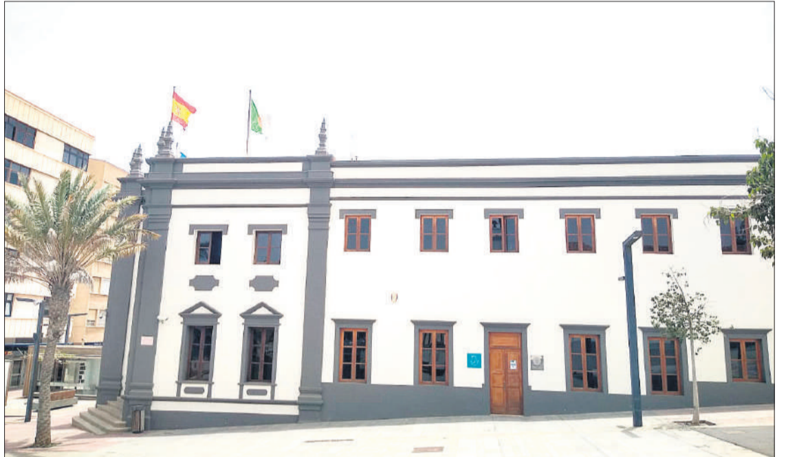
Sede principal del Cabildo de Fuerteventura.

Los presupuestos participativos suponen que sean las vecinas y los vecinos quienes tomen decisiones sobre las inversiones que se ejecutarán con un porcentaje del presupuesto aún por definir, con el objetivo de que los vecinos participen de manera abierta, activa y mediante un proceso responsable, democrático y