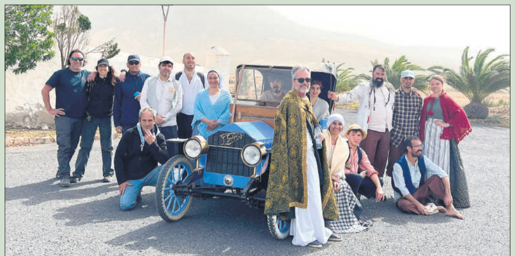
SE ESTRENA 'SAN MANUEL BUENO, MÁRTIR' . El pasado 29 de abril se estrenaba el cortometraje 'San Manuel Bueno, mártir', una adaptación de la obra de Miguel de Unamuno realizada por el majorero Adrián Tejero y financiada por el Ayuntamiento de Puerto del Rosario, a través de la Concejalía de Cultura. La proyección de este cortometraje, de 25 minutos, pone en valor la producción cinematográfica en el Municipio.