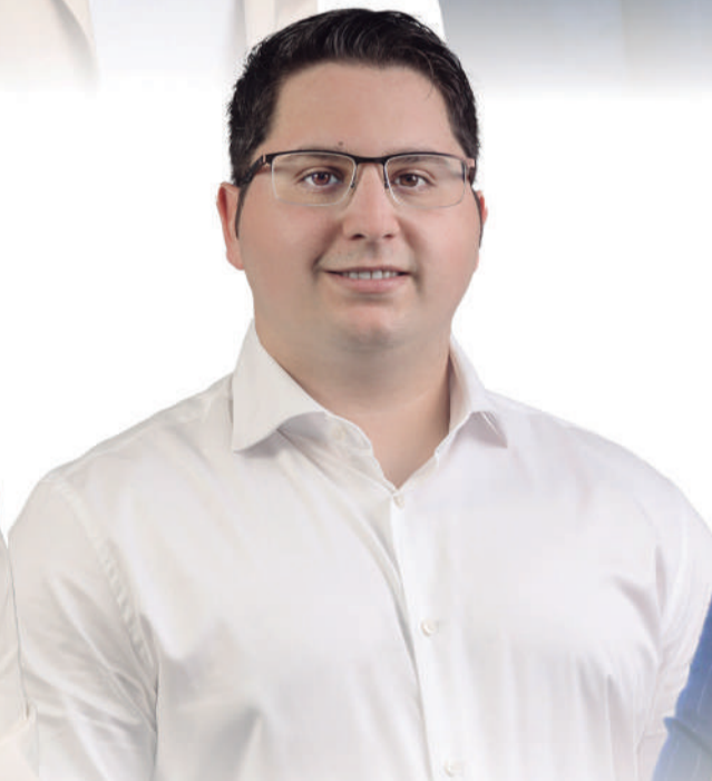
JAVIER OVIEDO Candidato a la Alcaldía de Betancuria