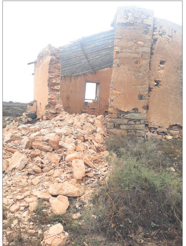
Taro de Tegurey.

Pero cabe apuntar que no todo es absolutamente negativo, existiendo puntuales decisiones que son dignas de mención. Las que consideramos de mayor importancia en los últimos meses se han dado precisamente desde la Institución insular, que ha logrado avanzar más en la cuestión en cinco meses que en las últimas dos décadas. Nos referimos a la decisiva y valiente intervención en el señaladísimo taro de Tegurey, que durante más de 30 años se había reclamado proteger e incluso adquirir para lograr frenar su progresivo deterioro y que en los últimos meses supuso que casi la mitad se cayera. Podemos señalar también la conclusión del proceso de adquisición de las casas de La Florida, demandada por muchos vecinos de Tuineje, considerándolo un elemento que merecía conservarse. Concluye este progreso en la cuestión con la compra de tres señalados inmuebles históricos del centro de Puerto del Rosario que podrán disfrutar de un futuro digno y sin la constante amenaza de la pi-