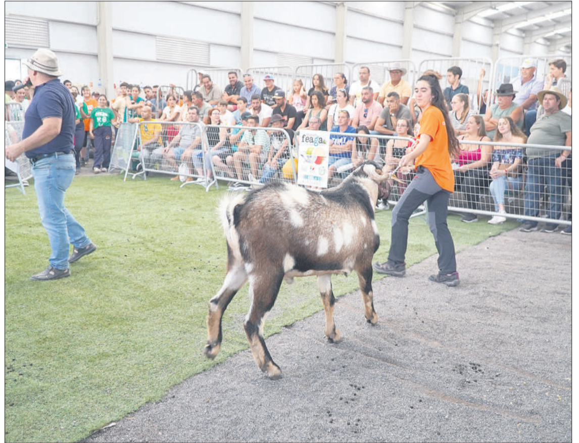
Imagen de archivo de una subasta de ganado en Feaga 2022.

Para los días 12 al 14 de mayo, la Feria contará con diversas exposiciones de productos y ganado, elaboración de alimentos, seminarios, charlas, espectáculos de baile y música en vivo, concursos, catas de vino, exhibiciones