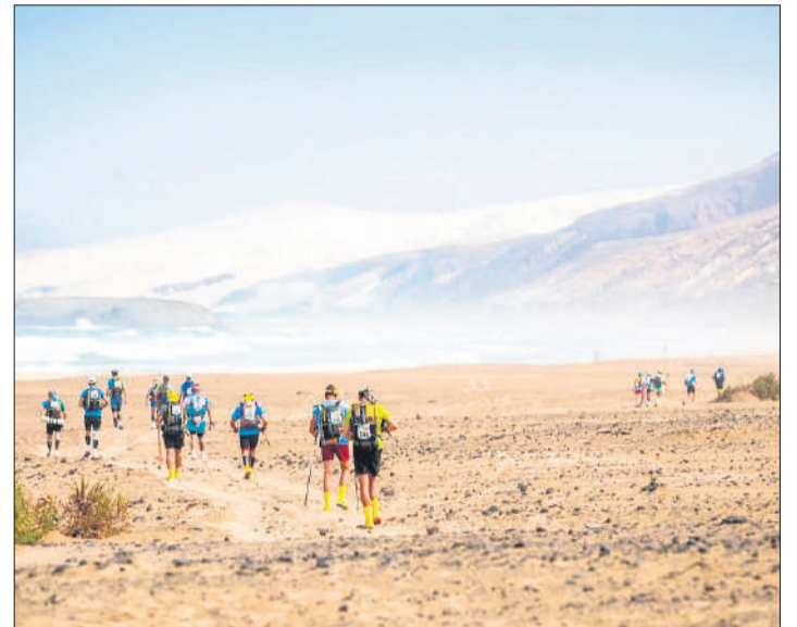
Imagen de archivo de una de las últimas ediciones de la prueba.

Cultural Peña de la Amistad, Yoga OM Fuerteventura, Club Deportivo Riga Gym, Macrofit, Club Deportivo de Beisbol Indomables, Caiman Verde Fuerteventura y Club Deportivo de Beisbol Petroleros de Puerto del Rosario.