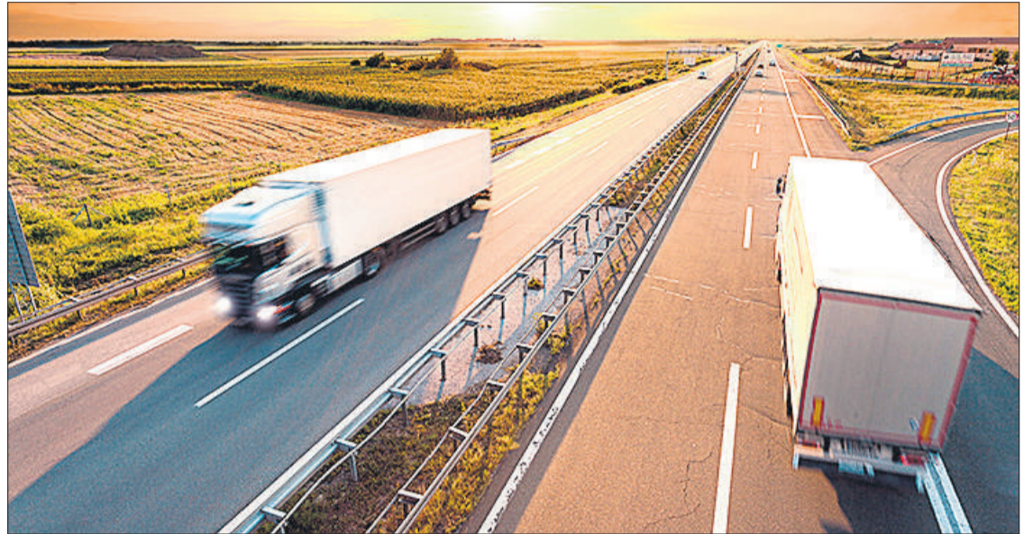
Campaña puesta en marcha el pasado año por la DGT para la prevención de accidentes.

Es necesario que no se abuse de las horas de conducción, respetar la legislación en cuanto a los descansos, así como el uso del tacógrafo, que viene a ser la caja negra del vehículo donde se registran unos datos importantes, también para denunciar los abusos de las horas de trabajo como de las veloci-