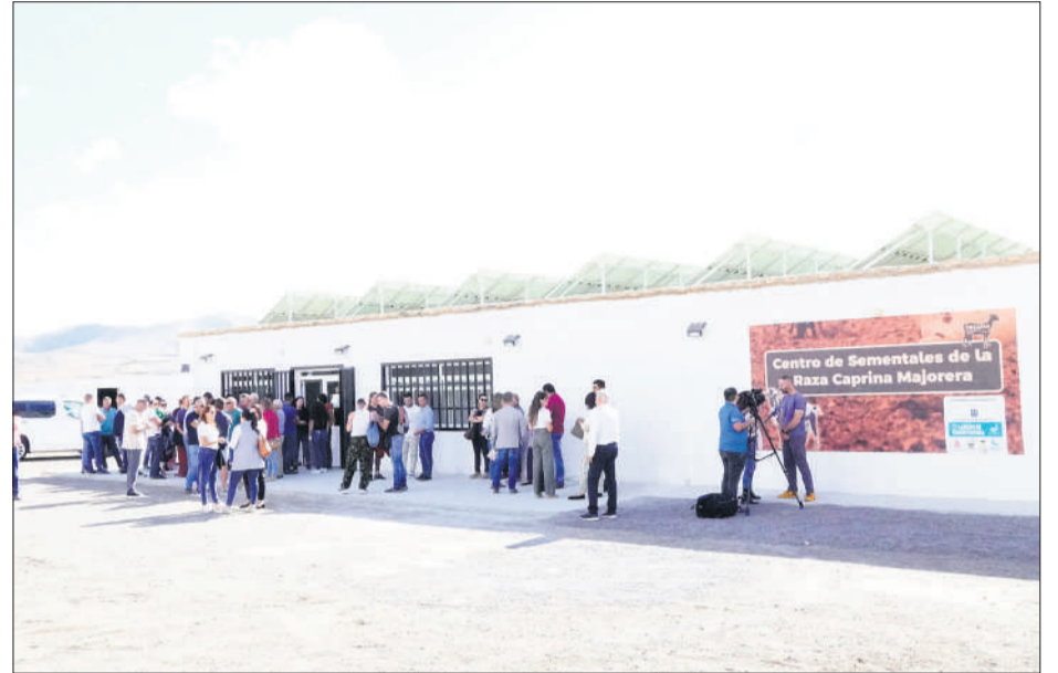
Centro de Sementales de la Raza Caprina Majorera.