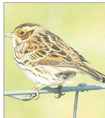
Emberiza pusilla .

A pesar de todas estas observaciones (algunas empíricas y otras como parte de una seria investigación científica) acerca del efecto del cambio climático sobre las poblaciones de aves en el ámbito de las Islas Canarias, estos estudios siguen siendo muy escasos y se han centrado, fundamentalmente, en conocer factores relacionados con la biogeografía y, en menor medida, con la fenología de la migración de un grupo de especies que durante el período de migración visitan las Islas o las usan como lugar de invernada. Pero esto