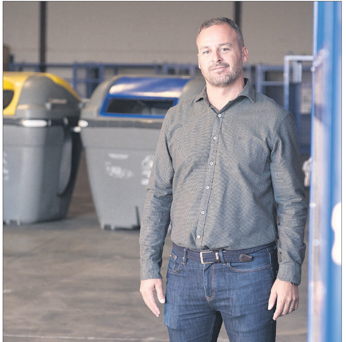
Enrique Pérez, consejero de Residuos del Cabildo de Fuerteventura.

Toda la información sobre los puntos limpios puede consultarse en las redes de Fuerteventura Recicla ( https://www.facebook.com/ftvrecicla ) y en el Área de Residuos de la web cabildofuer.es ( https://www.cabildofuer.es/cabildo/areas-tematicas/aguas-y-residuos/ ).