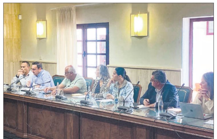
Concejales del PP en el Ayuntamiento de La Oliva.

El edil explicó que los conductores no pueden acceder de forma directa desde Puerto del Rosario al núcleo de Parque Holandés y La Caleta e, igual-