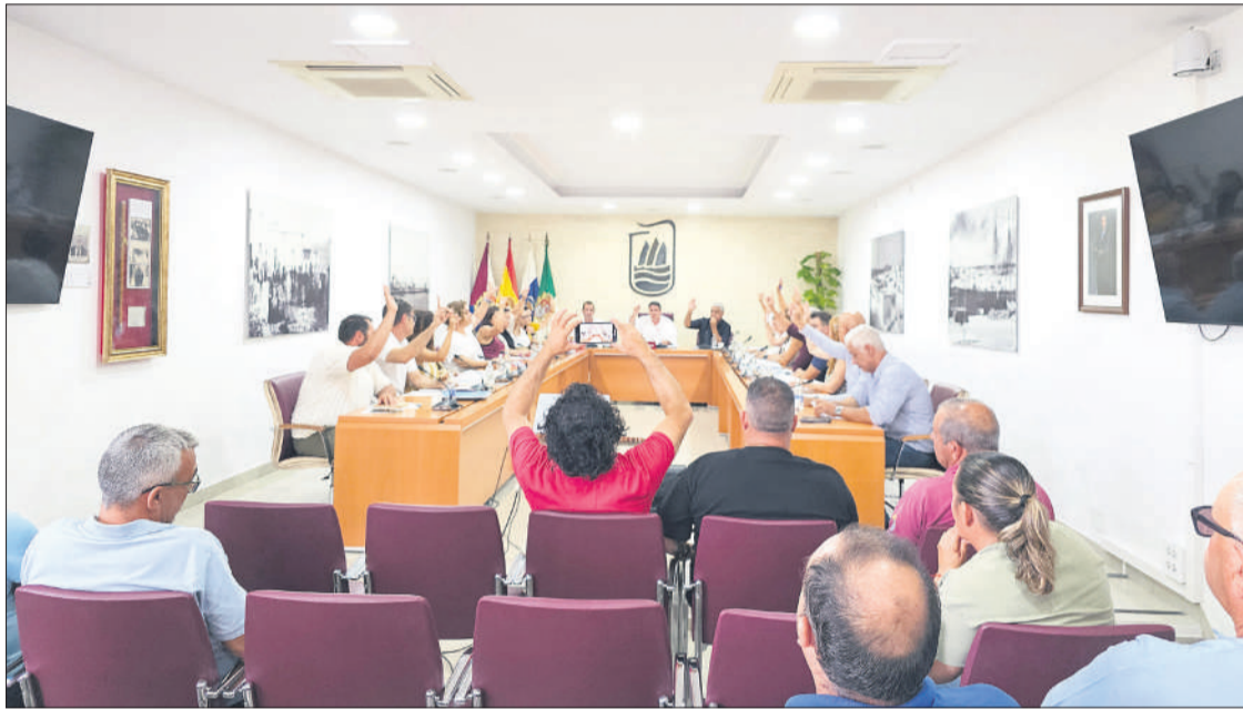
Pleno celebrado en el Salón del Ayuntamiento de Puerto del Rosario el pasado mes de julio.

● Las licencias están enmarcadas dentro de un plan municipal de transporte