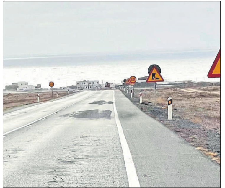
Obras paradas desde hace meses a la altura de las Salinas del Carmen.

La foto tomada recientemente es en la carretera FV-