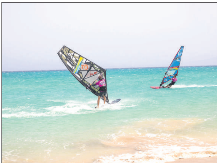
Algunos de los regatistas durante la competición de Freestyle.

del Windsurf y el Wingfoil se dan cita en uno de los rincones del planeta donde se pueden practicar ambos deportes todo el año. No en vano, un total de 59 riders (42 hombres y 17 mujeres) procedentes de 14 países han disfrutado de intensos días de viento.