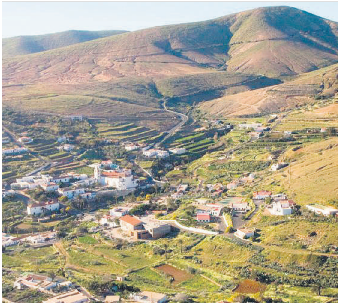
Parque Rural de Betancuria.

Ya en los sesenta, en las zonas de Castillo de Lara y Parra Medida -en las que anteriormente ya se había venido desarrollando una importante labor de reforestación-, se continuará trabajando, al igual que también se hacía en las zonas no repobladas y que esta-