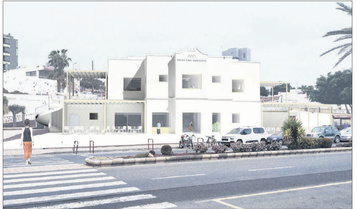
Infografía que muestra el futuro del Mercado Municipal de Puerto del Rosario.

“Vamos a contar no solo con un Mercado Municipal renovado, sino con todo un referente para Puerto del Rosario”, asegura Gutiérrez, porque lo que está claro es que “potenciará la vida en torno a la ave-