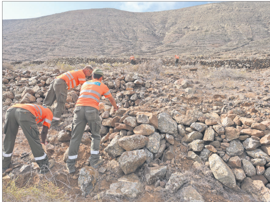
Operarios actúan sobre los muros de piedra de Vallebrón, acción que forma parte de su rehabilitación.