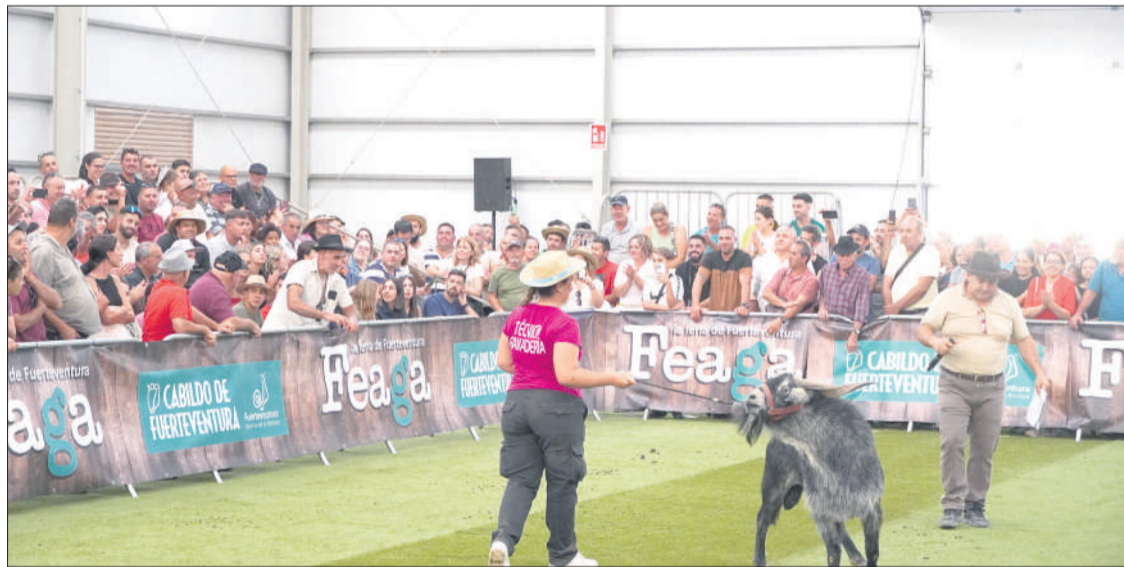
Imagen de archivo de la subasta de machos celebrada en la pasada edición de Feaga.