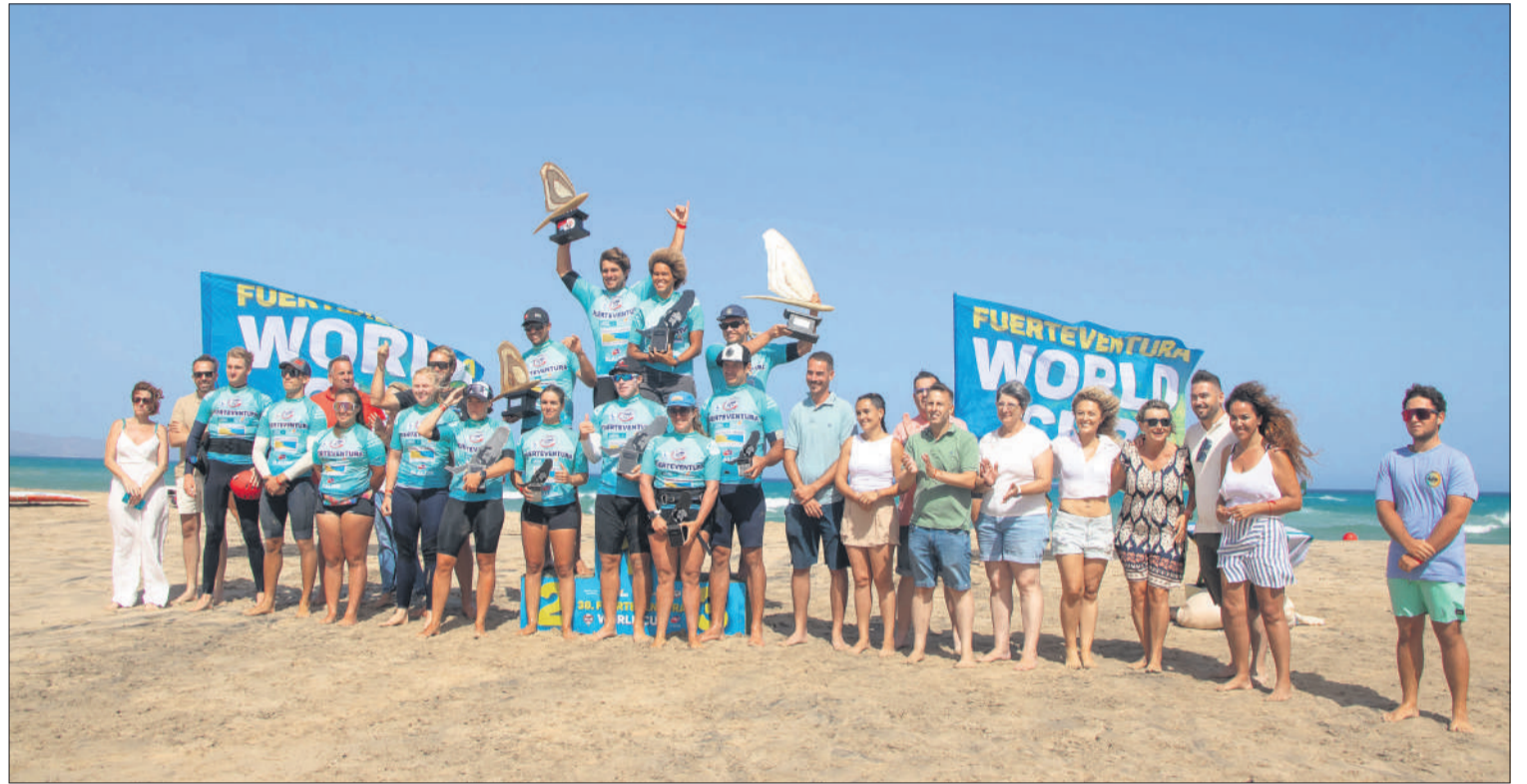
Foto de familia de los vencedores y las autoridades políticas en la XXXVI edición del Mundial.