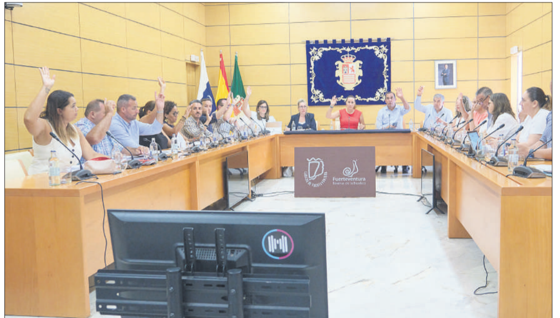
Pleno celebrado el pasado mes de julio en el Cabildo de Fuerteventura.

Asimismo, la Institución insular apoyará la empleabilidad en los diferentes ayuntamien-