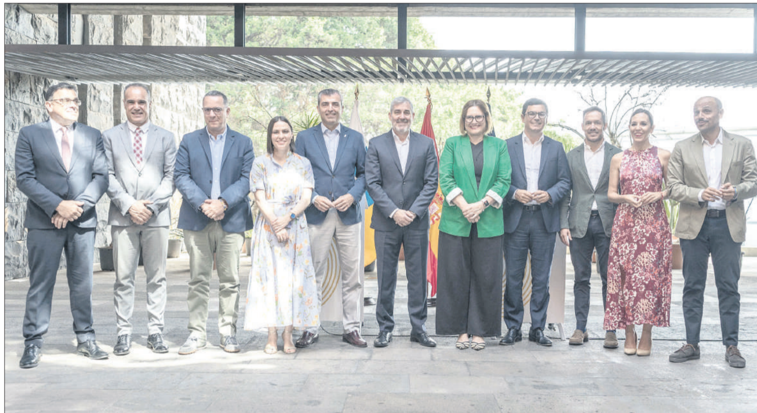
Clavijo y Domínguez, junto al resto del Ejecutivo canario.

A juicio de ambos, una parte fundamental de esta capacidad de reacción y gestión reside en la unidad y cohesión interna con que el Gobierno ha trabajado. Subrayaron que todo el Ejecutivo ha centrado su trabajo en resolver los problemas de los canarios y canarias, sin dedicar tiempo a polémicas estériles.