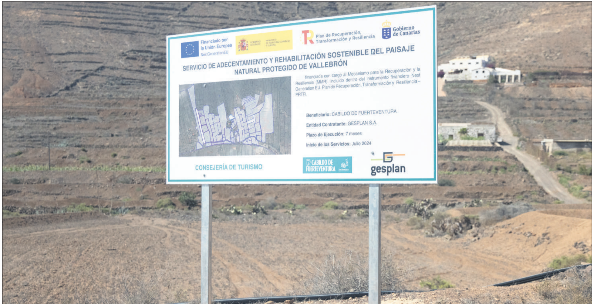
Cartel explicativo del proyecto que recuperará los sistemas agrarios del Paisaje Natural Protegido de Vallebrón.

Destinado a impulsar la economía verde y mejorar el binomio turismo y medio ambiente desde el respeto al entorno natural, la Consejería insular de Turismo pone en marcha este proyecto incluido en el plan 'Fuerte por Naturaleza'