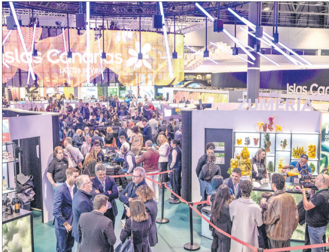
Imagen general de Fitur 2025, en Ifema.