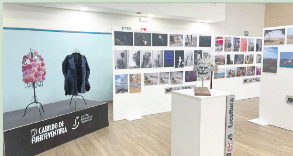
'MAXO ARTE TOUR' RECORRE LA ISLA CON NUEVAS CREACIONES ARTÍSTICAS. La Consejería insular de Juventud llevará la exposición itinerante 'Maxo Arte Tour' un año más por los diferentes rincones de la Isla. Se trata de una muestra que reúne el talento creativo de los jóvenes artistas participantes en el certamen Maxo Arte Joven 2024.