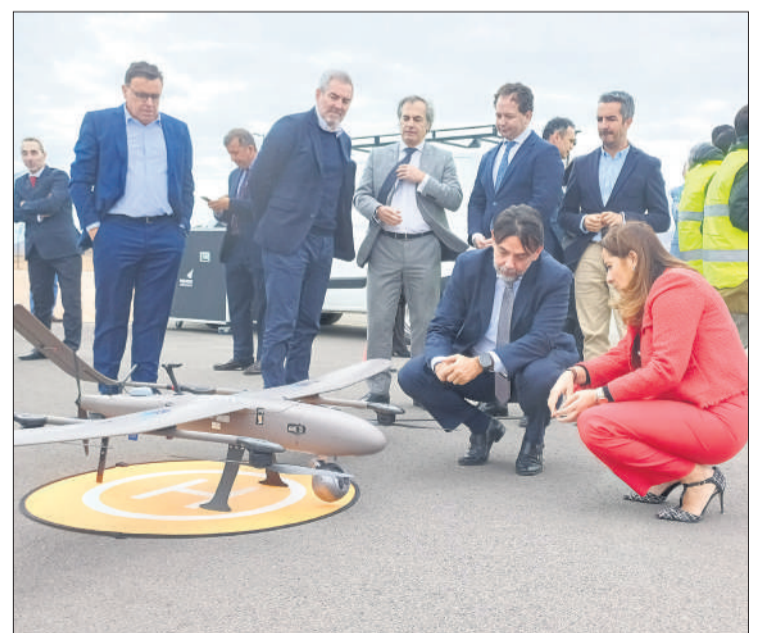
Autoridades políticas visitan el Stratoport for Haps en el PTF.

Tras la rúbrica de este “histórico” contrato, Clavijo destacó la importancia de que Canarias cuente con el Falco EVO como recurso innovador para la lucha contra los in-