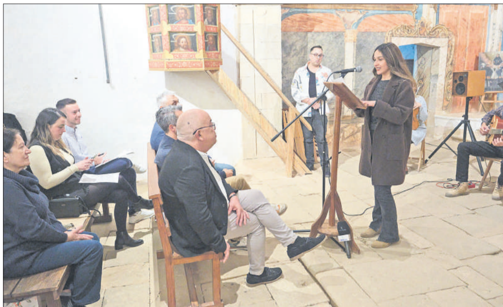
El público disfruta de las obras presentadas en el II Concurso de Poesía y Microrrelato.