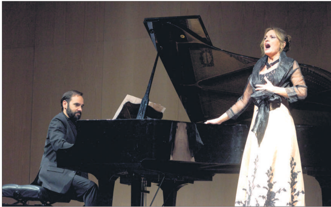
Imagen de archivo de la soprano Ainocha Arteta, en su último concierto ofrecido en la Isla.

El Palacio de Formación y Congresos se inauguró un 8 de enero de 2015 con el concierto de Juan Diego Florez, intérprete internacional de ópera. Ese mismo año, tuvieron lugar eventos tan destacados como la producción majoreña