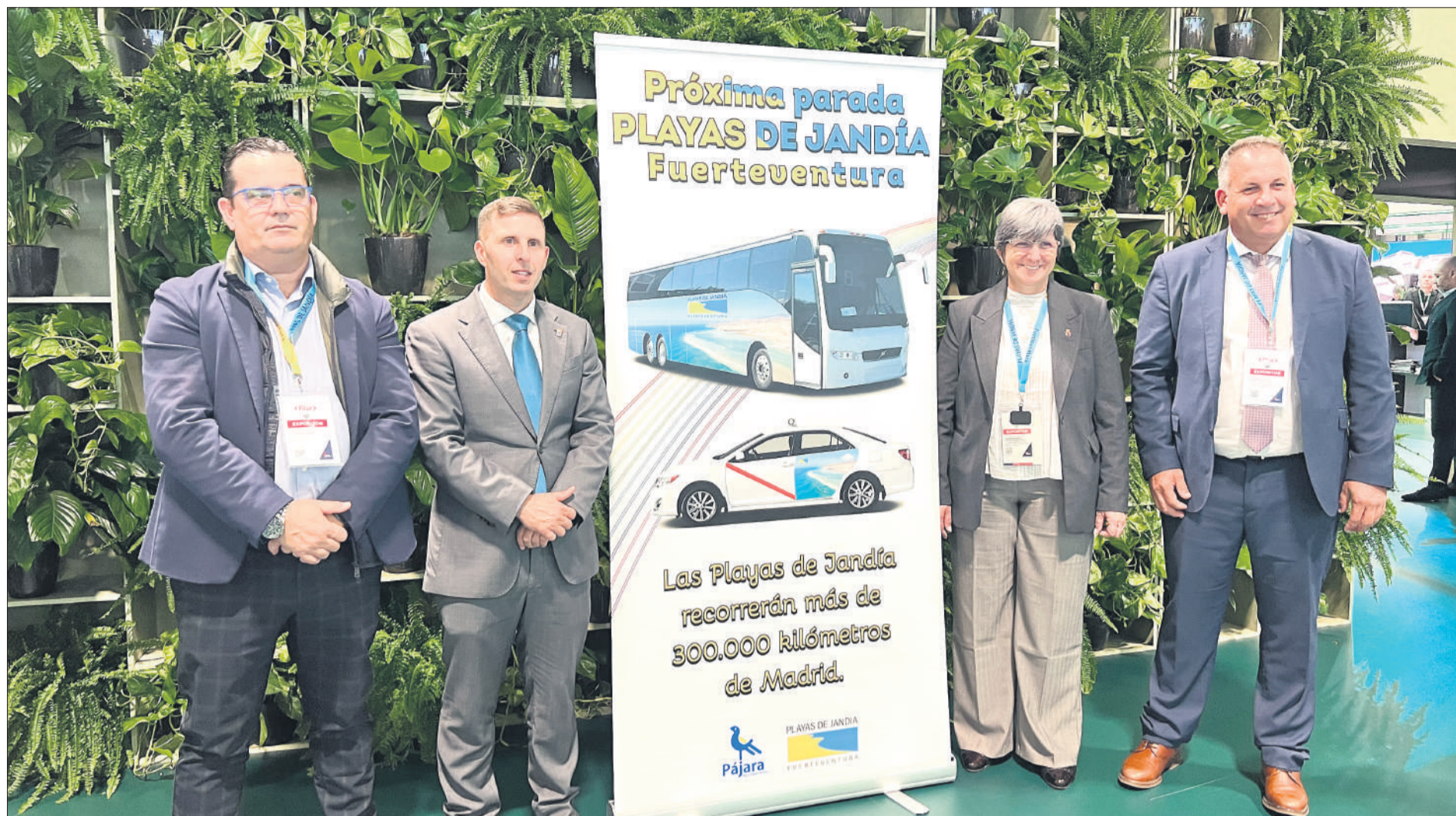
Presentación de la campaña promocional que el Ayuntamiento de Pájara desarrollará en Madrid para incrementar el mercado nacional en Semana Santa.