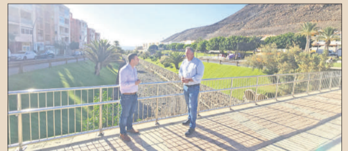
VALLADO SUSTITUIDO EN EL CIERVO. La Concejalía de Obras del Ayuntamiento de Pájara ha concluido la mejora la seguridad en la zona del Barranco del Ciervo con la sustitución del vallado. Esta acción, con un valor de 650.000 euros.