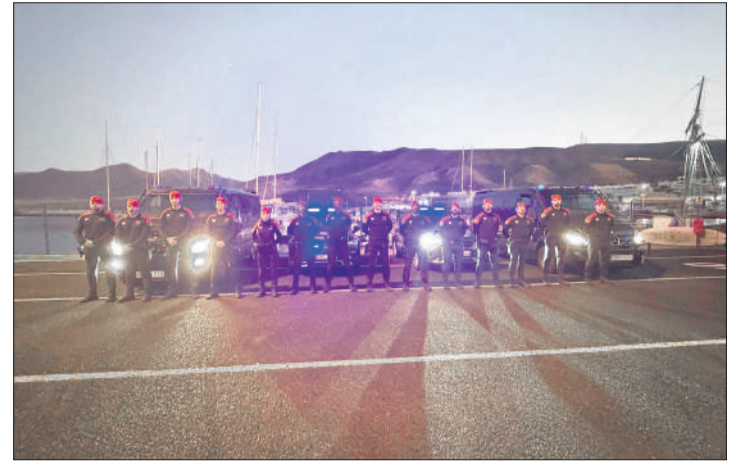
Dispositivo de la Policía Canaria desplazado al municipio de Pájara.