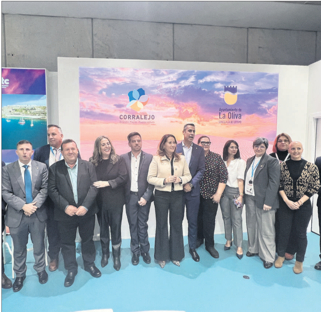
Parte de la delegación mayorera en Fitur 2025.