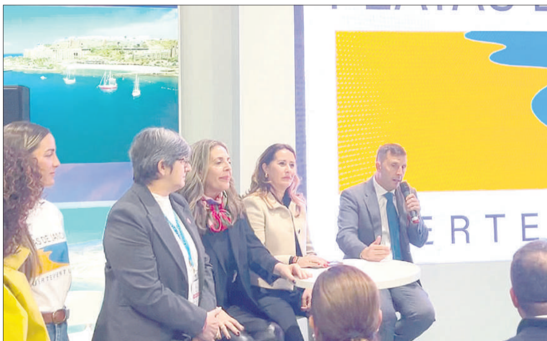
Presentación de Pájara en el expositor de la AMTC.

Entre los objetivos de esta campaña visual, que se desarrolla en la misma línea exitosa de la campaña realizada en los taxis de Londres durante la celebración de la pasada World Travel Market , destaca que miles de personas po-