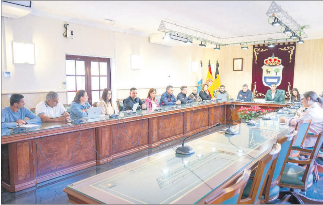
Pleno extraordinario para la aprobación de la RPT en el Ayuntamiento de La Oliva.