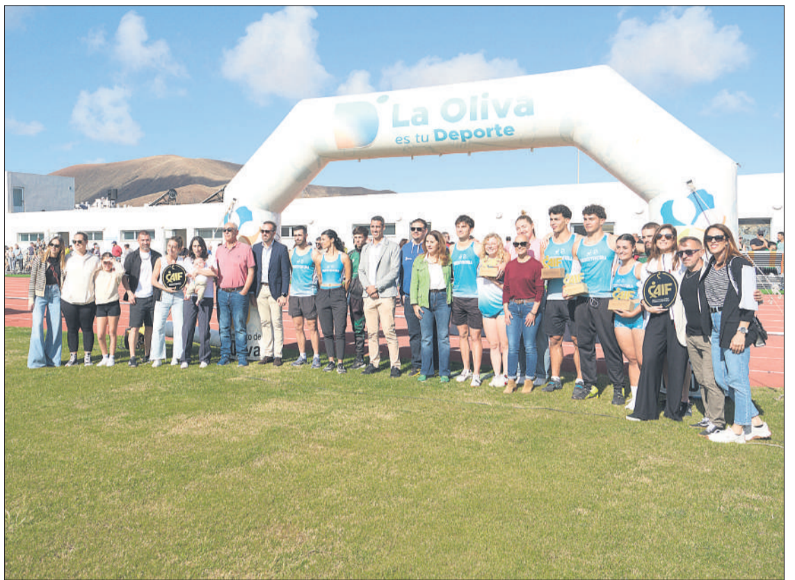
Momento de la inauguración del Centro de Atletismo Insular de Fuerteventura.

Con posterioridad a la inauguración, se realizó un ho-