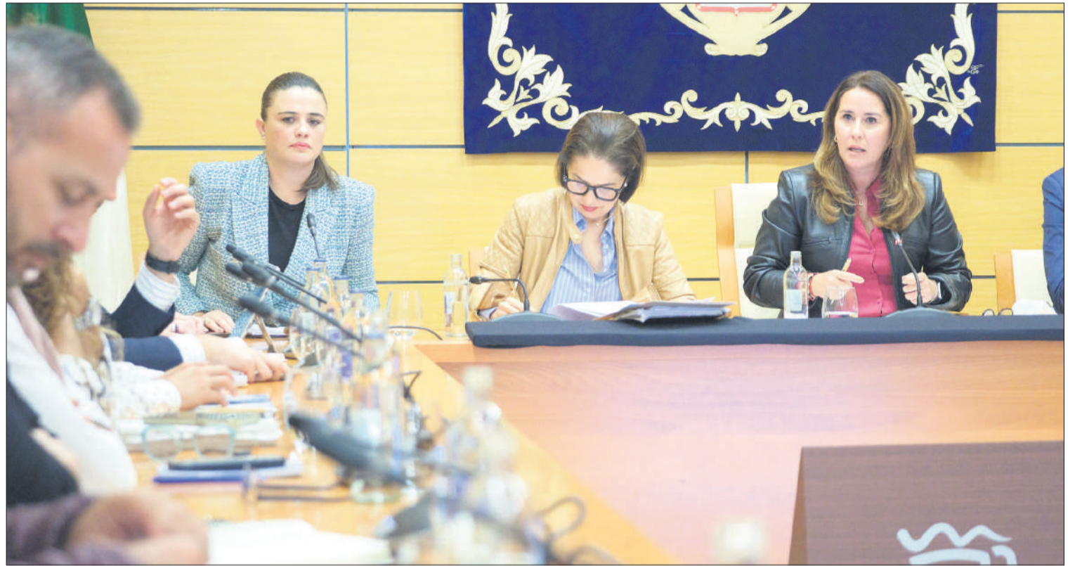
Pleno extraordinario celebrado el pasado mes de enero para aprobar las cuentas de 2025 del Cabildo de Fuerteventura.

De la batería de obras que el Cabildo tiene previsto eje-