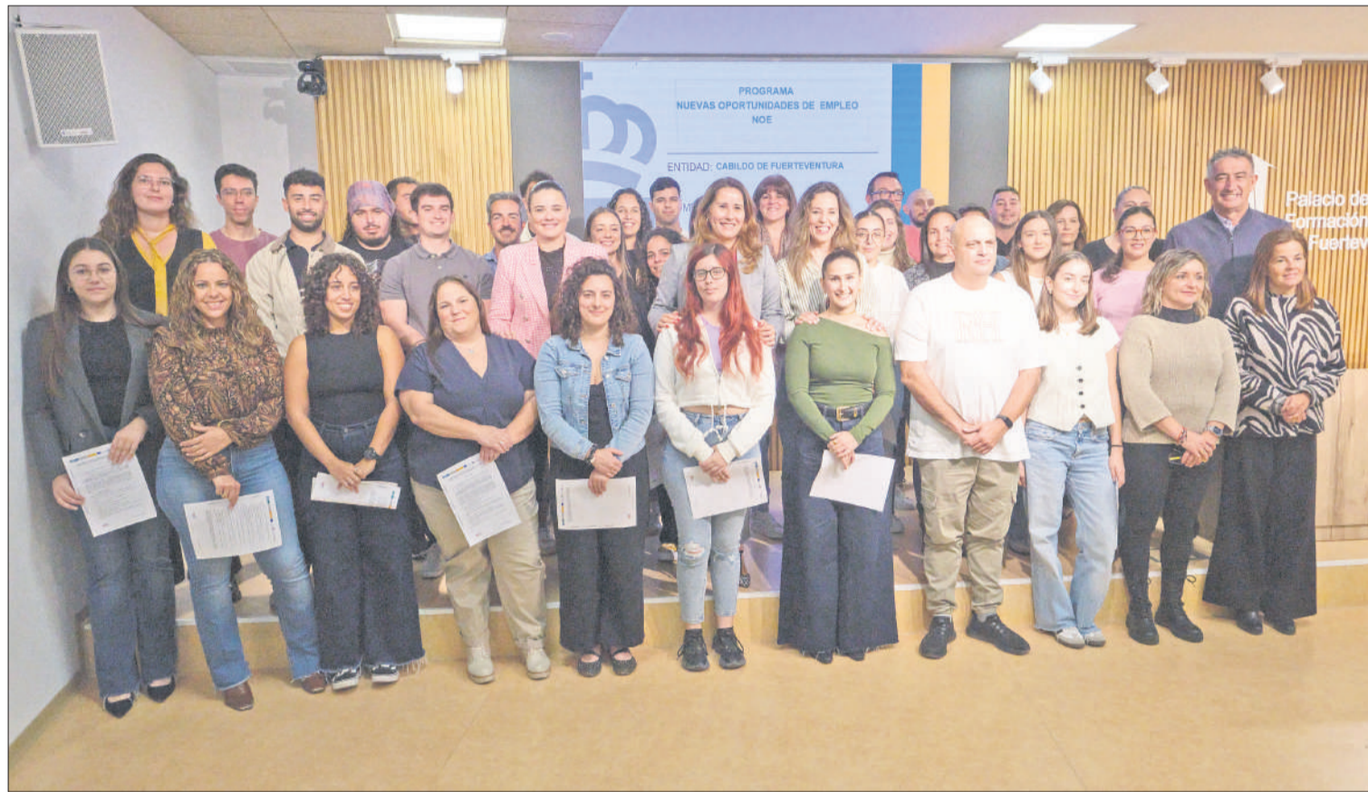
Foto de familia de las autoridades políticas junto a los 38 participantes en el programa NOE.