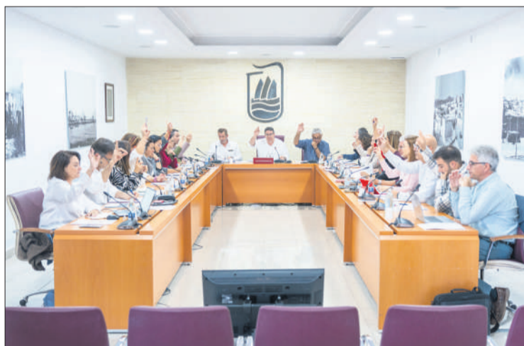
Pleno celebrado el pasado mes de enero.