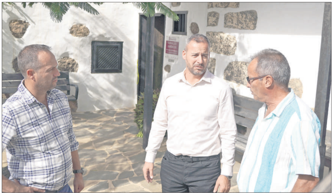
Concejales de Coalición Canaria en el Ayuntamiento de Betancuria.

La vivienda se encuentra también entre los incentivos para frenar el despoblamiento