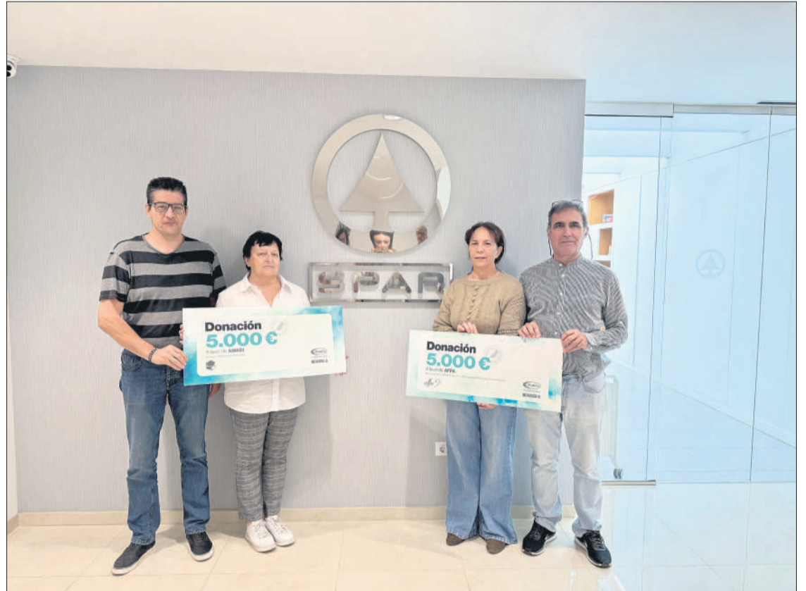
Los representantes de AMADI y AFFA, con los cheques donados por Spar Fuerteventura.

Cabe recordar que esta acción se enmarca dentro las diferentes colaboraciones y pro-