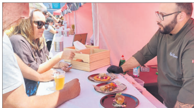
Los chefs atendieron las dudas de los visitantes a la Feria del Bonito.