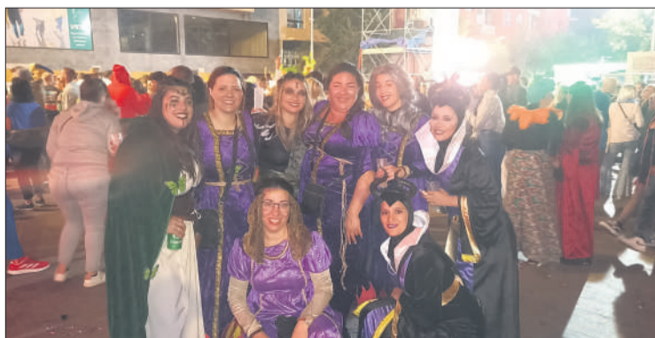
Vecinas de Morro Jable, disfrutando del Carnaval.