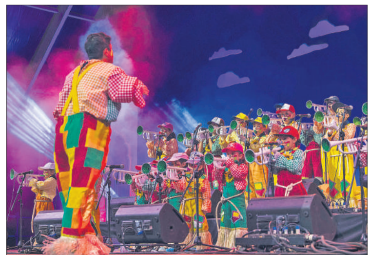
La murga Los Garabatos, del norte de la Isla.