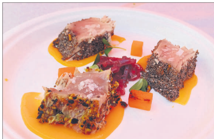
Uno de los platos que se pudieron degustar en esta tercera edición.