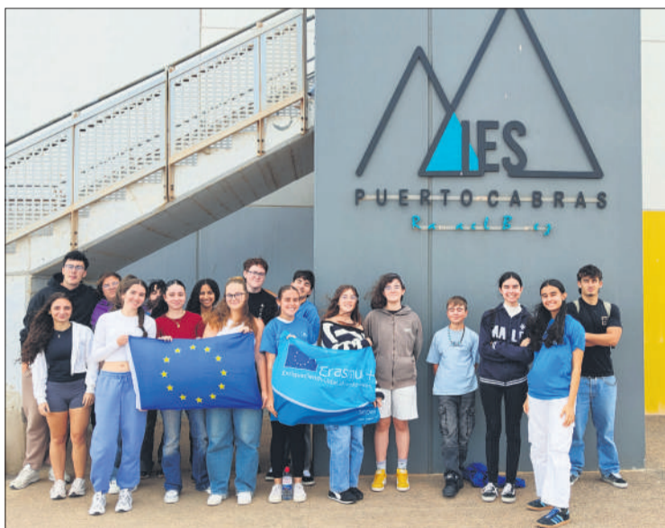
Foto de grupo del alumnado participante en esta experiencia.

El tema central de las actividades estuvo relacionado con el agua y su protección. Durante las estancias en los diferentes países, los grupos participaron en talleres interactivos, visitas guiadas a espacios naturales y actividades educativas que destacaron la importancia de cuidar este recurso esencial. Estas experiencias no solo promovió el aprendizaje académico, sino que también alentó a los estudiantes a reflexionar sobre su