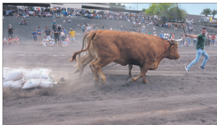
El arrastre del ganado, una de las actividades programadas en Feaga.

pre han hecho esta cadena de alimentación majorera por dar prioridad a la comercialización de los productos elabora-