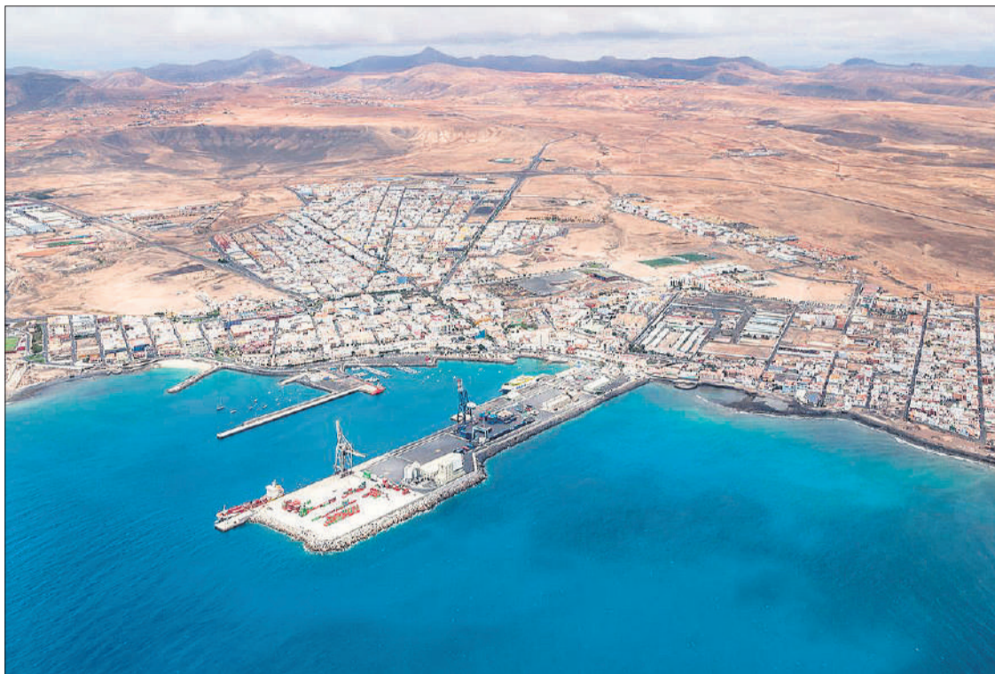
Vista aérea del puerto comercial y de cruceros de Puerto del Rosario.

mejorará la seguridad y operatividad del puerto, al tiempo