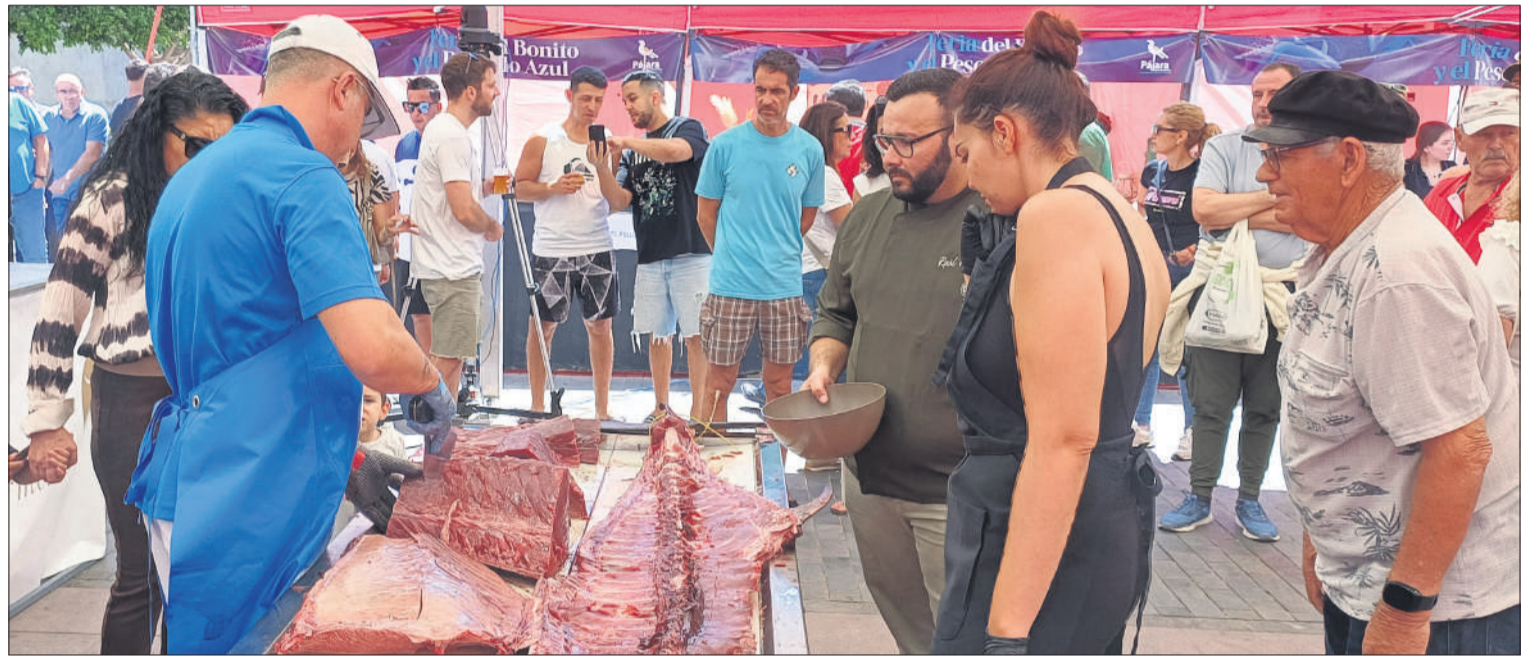
Visitantes a la feria observan el proceso del despiece artesanal del atún rojo, conocido popularmente como ronqueo.

Otro de los eventos que llamó la atención de los asistentes fue la demostración del