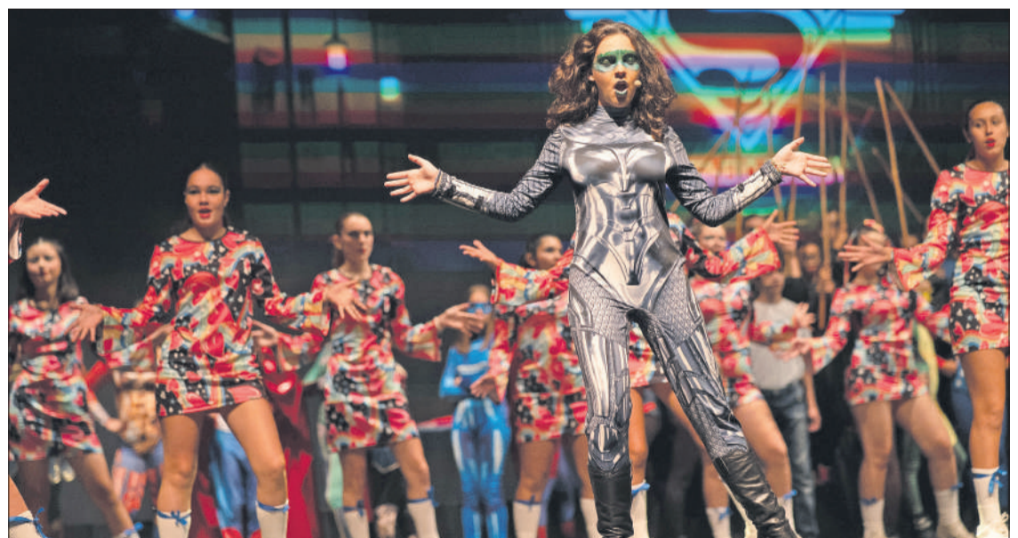
Imagen de Superheroes of Atlantic , el musical que alumnos y profesores representaron el pasado año.

Éxitos actuales de artistas como Beyoncé, Ariadna Grande, Kylie Minogue o The Weeknd se entremezclan con temas noventeros de artistas como