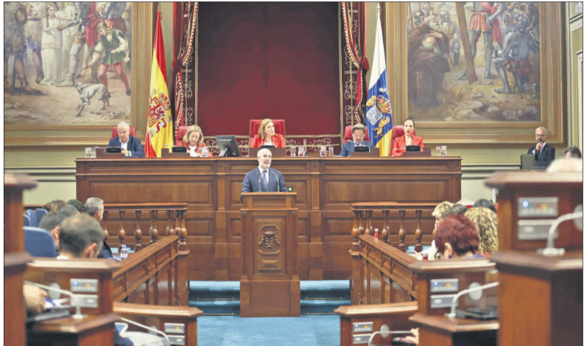
Fernando Clavijo, durante su discurso de apertura en el Debate sobre el Estado de la Nacionalidad.

En ambos foros “Canarias pondrá sobre la mesa la necesidad de que se establezcan límites en la adquisición de viviendas por parte de no residentes, al igual que ya se hace en aquellas islas europeas que lograron introducir esta excepción antes de su entrada en la UE”. Reconoció que lograr este objetivo no será fácil, pero también recordó que Ca-