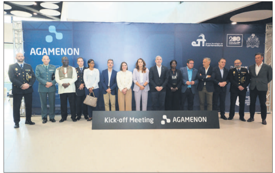
Foto de familia de las autoridades durante de la presentación de AGAMENON.