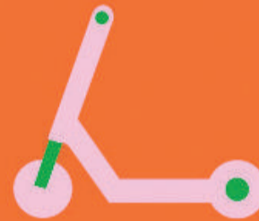
Imagen de una campaña de la DTG dirigida a los conductores de patinetes.

#PorLaAceraNO Si los vehículos van por la calzada, tu patinete también.